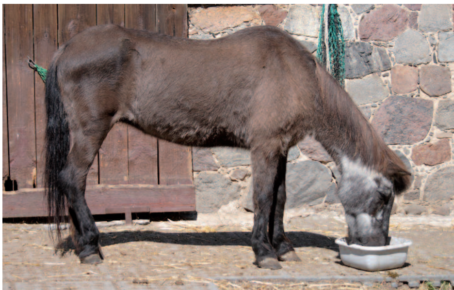
47 Jahre ist die Bosniakenstute der Autorin alt – ohne Grascobs wäre das unmöglich gewesen!

Für stark heustaub-allergische Pferde ist sie schon einmal ein Segen, bekommt das Pferd doch so die nötige Menge Raufutter