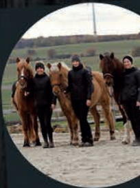
threeicelandix Islander Influencer