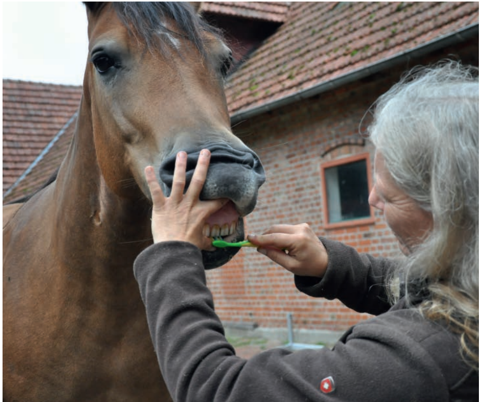
Zahnkontrolle und Pflege – mit der richtigen Vorbereitung ist das Pferd aktiv und willig dabei.