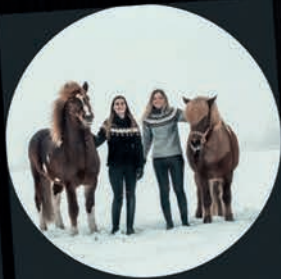
Takt und Verstand Content Creator & Podcaster