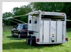
Integriertes, optionales RoFlex Zaunsystem für professionelle Paddocks