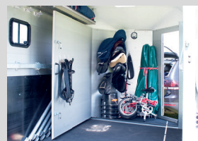
Geräumige Sattelkammer mit schwenkbarem Aluminium-Zwischenwand zum Pferdeabteil

Der neue Traveller 145 ist auf Basis der bewährten Böckmann Traveller-Klasse speziell für die Bedürfnisse der Islandpferde und deren Reiter weiterentwickelt worden. Viele praktische Ausstattungsdetails machen die Handhabung zum Kinderspiel und bieten optimalen Komfort sowie maximale Sicherheit für Ihr Pferd. Mehr Infos unter: www.boeckmann.com