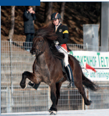
TEIGUR VOM KRONSHOF DE2002134228 Stckm.: 143 CM - BLUP: 125 V: Otur frá Sauðárkróki - M: Næpa vom Kronshof FIZO: 8.46 / 8.84 / 8.63

FIZO: 9,0 8,5 9,0 8,0 9,5 9,0 7,5 8,5 8,0 8,84 Trot Trab Pass Galopp Schritt u.d.R. Schrittl. Trab. Galopp schreiten