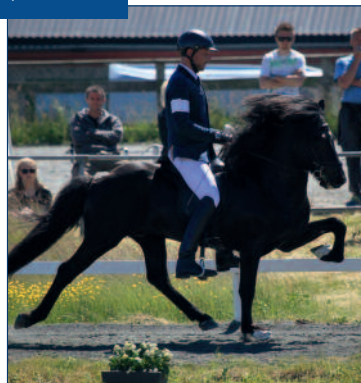
VIKTOR FRÁ DIISA DK2004103659 Stckm.: 143 CM - BLUP: 125 V: Garri frá Reykjavik - M: Svana frá Neðra-Ási FIZO: 8.48 / 8.74 / 8.63

FIZO: 9,0 8,5 7,5 9,5 9,0 8,5 9,0 8,5 9,0 8,5 8,74 Trot Trab Pass Galopp Schritt u.d.R. Schrittl. Trab. Galopp schreiten