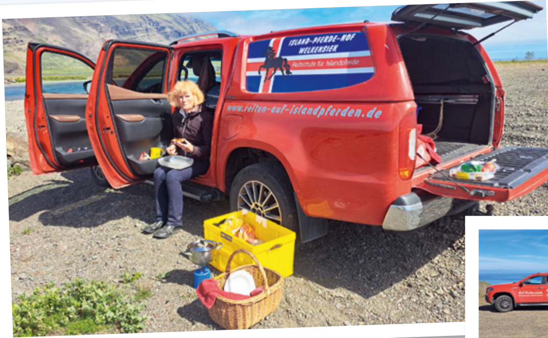
Picknick vor dem Breiðamerkurjökull.