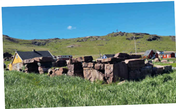
Die einstige Wikingersiedlung Gardar.

Ort mit 10 – 20 Einwohnern, hübschen Häusern aus rotem Sandstein, einer Schule mit drei Schülern und einem Lehrer, Supermarkt, Hafen, einer feinen Kirche mit Pastorenhaus daneben (bei Bedarf kann der angereiste Pastor dort wohnen) und einem Ruinenfeld aus großen roten Sandsteinblöcken, bewegendes UNESCO-Weltkulturerbe.