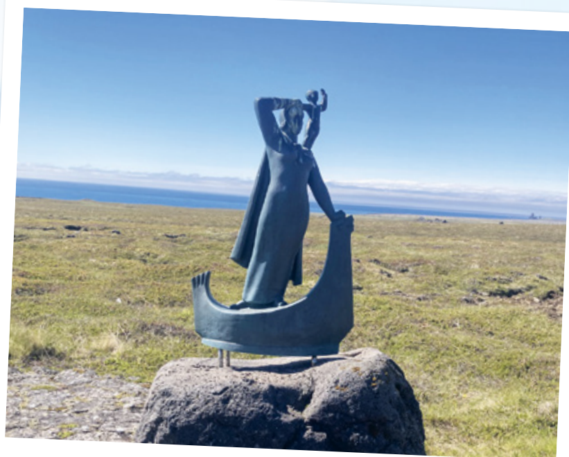
Guðríðr auf Laugarbrekkur.

Der Besuch auf Laugarbrekkur bei der geklauten und nun wieder vorhandenen Bronzefigur von Guðríðr bereitete uns gedanklich vor auf unsere nächste Station. Guðríðr por-