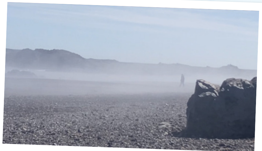
Am Elfenstrand von Djúpivogur.