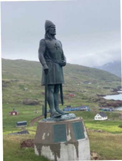
Leif Eriksson wacht hoch oben über dem Erikssfjord.