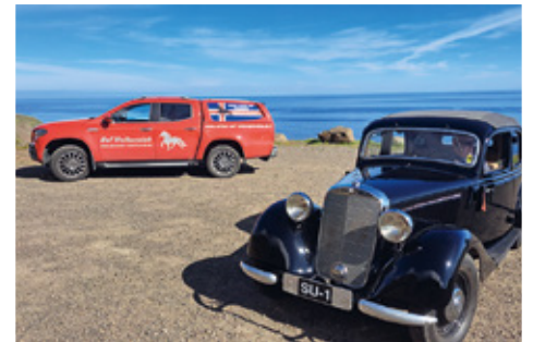
Mercedes X-Klasse Baujahr 2019 trifft Mercedes S-Klasse von 1937.

Ein Traum wird wahr – mit dem eigenen Auto nach