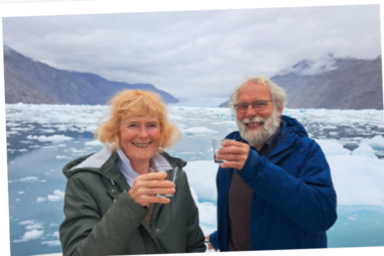
Zum Abschied von Grönland ein „Martini on the Rocks“.

die historischen Orte der Islandglocke, dem Nobelpreiswerk des großartigen Schriftstellers Halldór Laxness. Auch auf diesen Spuren wollen wir unterwegs sein, erklärt diese Lektüre doch so viel über die Entwicklung des isländischen Volkes, seinen Stolz auf das Land und seine bewegte und bewegende Geschichte. Alte Fundamentsteine finden sich neben der Bischofskirche und auch hier erwachen historische Gestalten zum Leben, man taucht ein in die Zeit, als der Isländer Árni Magnússon von Hofstelle zu Hofstelle zog, um die Reste der alten Handschriften (seit 1150 von Mönchen kunstvoll gefertigt) zu sammeln und so vor dem Verlust zu retten. Diese Sammlung, bewahrt in Kopenhagen (leider z. T. durch den großen Brand redu-