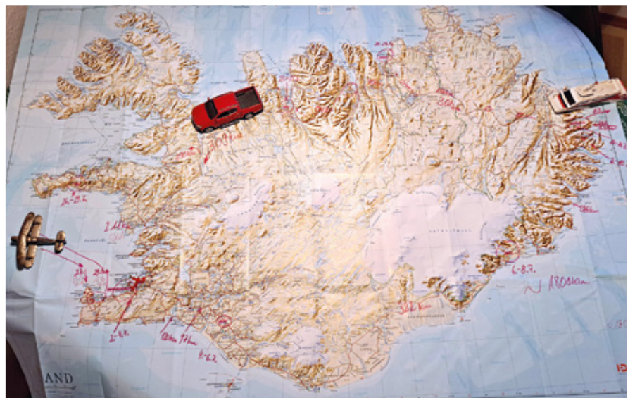
Ein Ziel ohne Plan ist nur ein Wunsch... Nun wurde er endlich Wirklichkeit: unsere Reise nach Island und Grönland mit Auto, Fähre und Flugzeug.