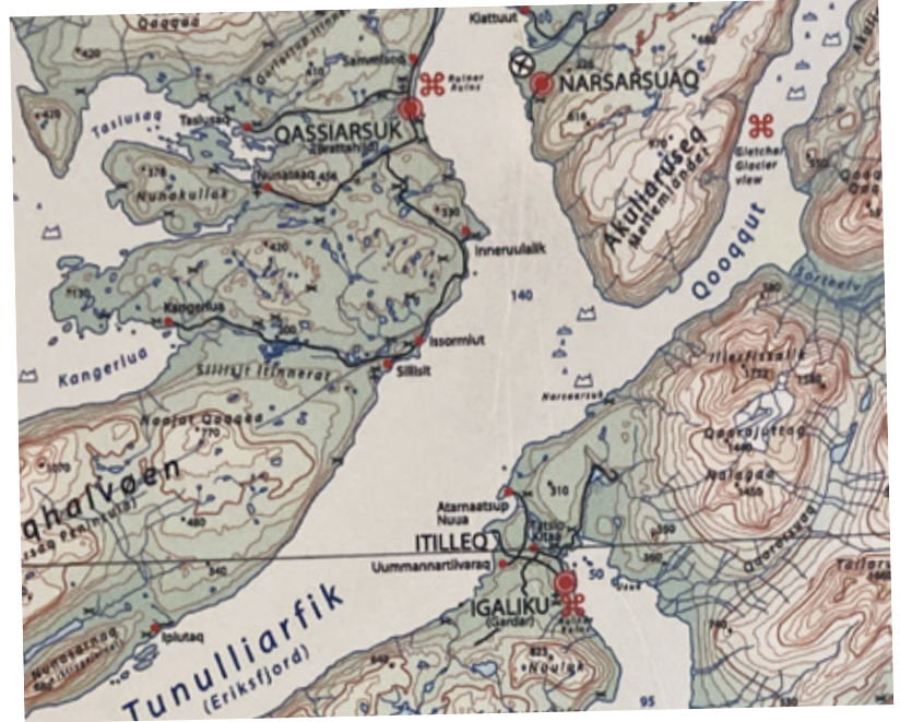
Eriksfjord und Einarsfjord.

Eine kurze Wassertaxifahrt über den Eriksfjord und am einsamen Steg Itilleq angekommen, beginnen wir pfadfindermäßig zu unserer Unterkunft in Igaliku zu hiken. Es begegneten uns: ein desinteressierter Hund, ein trockenliegendes Schiff, ein verlassener Trecker, eine dachlose Bude, ein paar Schafe und dann ein Wegweiser – jetzt wussten wir, woher wir kamen und wohin wir gingen. Eine letzte Wegbiegung und da lag Igaliku vor uns, der Ort der einstigen Wikingersiedlung Gardar (= Garten), wüst geworden vor ca. 500 Jahren; was die Bevölkerung damals auslöschte, ist unklar. War es die Klimaverschlechterung und die damit verbundenen längeren Winter, die Raubüberfälle durch die Engländer oder traf die eingeschleppte Pest auf geschwächte Siedler? Im frühen 17. Jahrhundert besuchten dänische Seefahrer die Siedlungen und fanden vom reichen Wikingerleben nur noch aufgegeben Höfe und verlassene Kirchen vor. Heute ist Igaliku, gelegen am Einarsfjord, ein